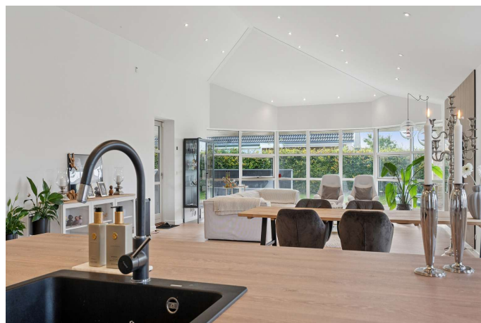
Kig fra køkkenen til stue