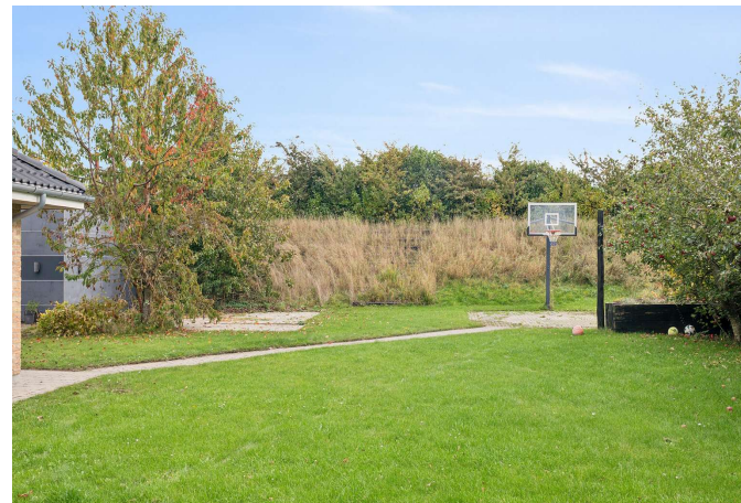
Dejlig børnvenlig have