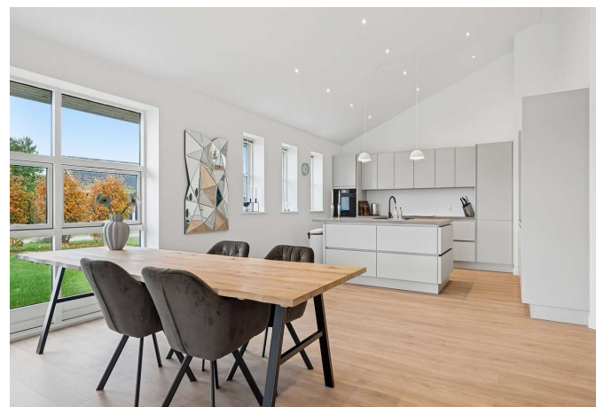
Kig fra stuen til de flotte nye køkken.